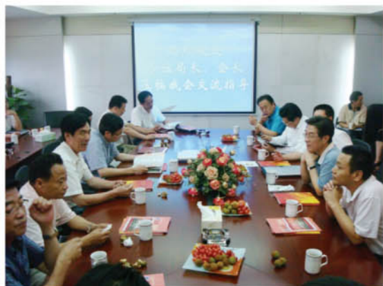
各地律协会长参观杭州市律师协会会所(1)