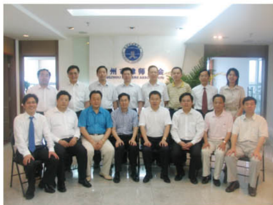
各地律协会长参观杭州市律师协会会所(2)

协会会长的模式。从2005年起至2007年3月,全省市级律协会长全部实现由执业律师担任,这标志着两结合律师管理体制在我省的实践已经进入了一个新的阶段。