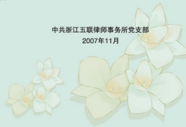
中共浙江五联律师事务所党支部 2007年11月

五联所这几年发展表明，加强共产党与各民主党派和无党派人士的团结合作，大家荣辱与共，精诚合作，对于共创五联所的美好未来，其实是非常重要的。