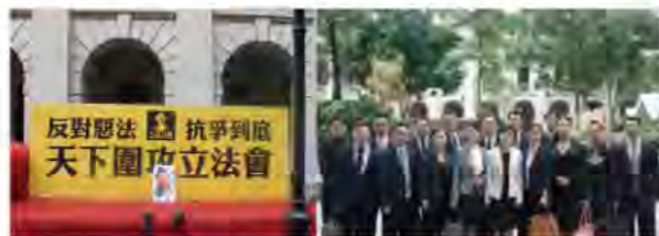
搭建在立法會門口的示威舞台