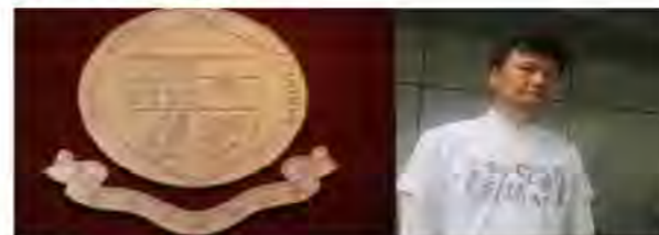
香港大律師公會會徽