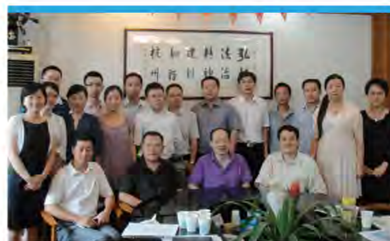
杭州青年律师香港考察团行前会议