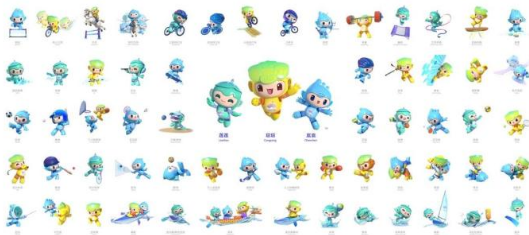
杭州2022年第19届亚运会吉祥物项目运动造型设计 Sports Versions of the Mascots for the 19th Asian Games Hangzhou 2022

在杭州亚运会吉祥物项目运动造型设计中，“江南忆”的三个吉祥物对竞技比赛动作进行了展示，把竞技运动定格在了饱含视觉冲击力的瞬间，充分展现了亚运会积极进取、活力青春的竞技精神。