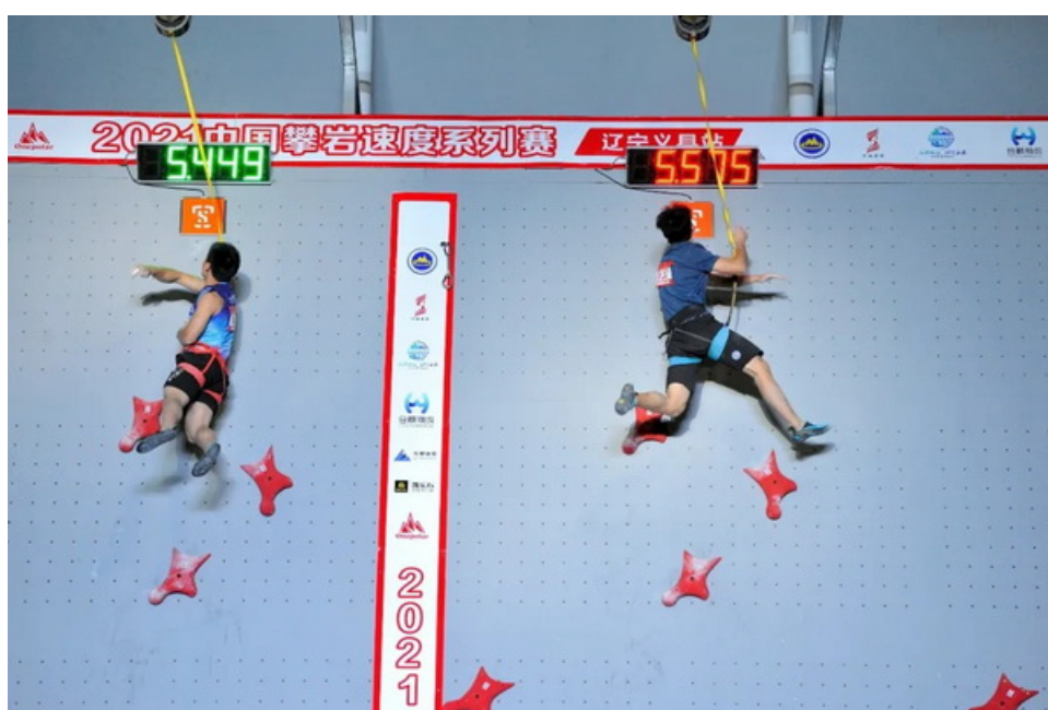
龙金宝夺冠瞬间

4月24日至25日，今年首场全国性攀岩赛事——2021中国攀岩速度系列赛(辽宁义县站)在义县大凌河国家湿地公园攀岩基地举行。龙金宝以5.44秒超世界纪录夺冠，中国攀岩喜迎开门红！在举世瞩目的东京奥运会即将开幕之际，中国攀岩奏响了铿锵有力的进军奥运的序曲。