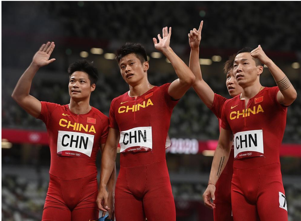
去年东京奥运会上的中国男子4×100米接力队